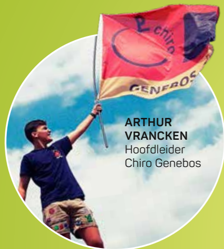
ARTHUR VRANCKEN Hoofdleder Chiro Genebos

Wie weet tonen we uw verhaal in onze volgende editie. Geïnteresseerd? Stuur een mailtje naar communicatie@limburg.net .