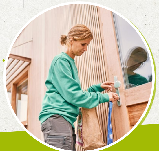
16:00u Tijdens de winter sluit het park om 16:00. Morgenvroeg staan onze parkwachters weer paraat.