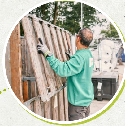
10:00u Onze parkwachter opent een nieuwe container voor het aeea (afgedankt elektrische en elektronische apparatuur).