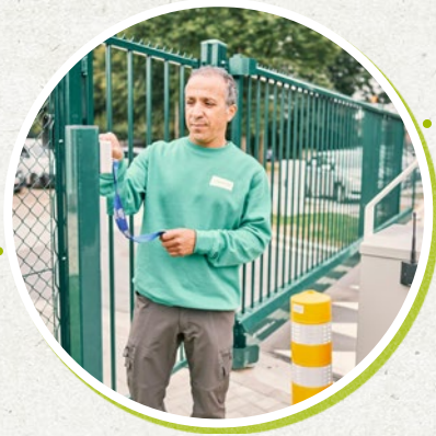
9:00u Om 9 uur opent de poort van het recyclagepark, de eerste bezoekers staan al klaar.