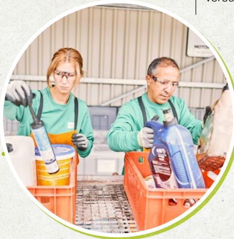
12:00u De parkwachters sorteren het binnengebrachte kga (klein gevaarlijk afval) voor verdere verwerking.