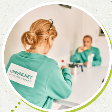
12:30u Het recyclagepark gaat even dicht voor een lunchpauze. Smakelijk!